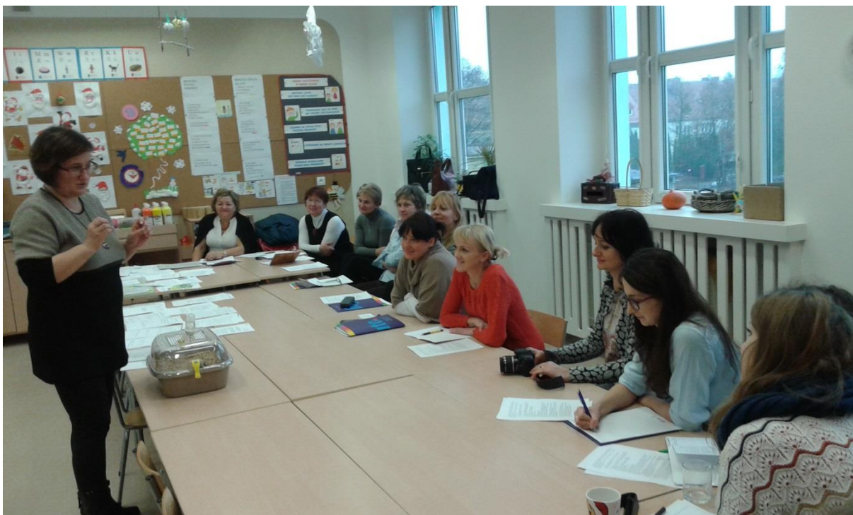
Warsztat - Prawo każdego ucznia do sukcesu.