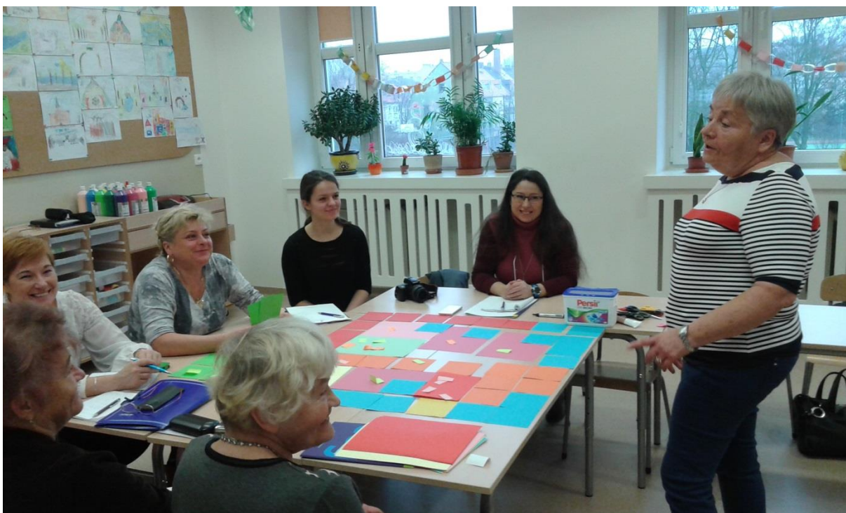
Szkołę i klasę traktujemy jak wspólne dobro.